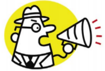
Imagen Pública y Relaciones Públicas

Al caminar por mi senda rotaria, identificaré oportunidades para promocionar la imagen pública de mi club y de Rotary para el beneficio de mi comunidad y del mundo.